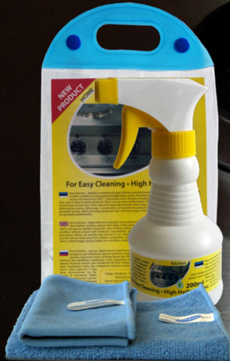
200ml komplekt Home.Kitchen

Sõltuvalt materjali pinnast kestab kaitsetoime alates 2 nädalast kuni 2 kuuni. Terase jaoks on see lühem, mööbli jaoks pikem tähtaeg.