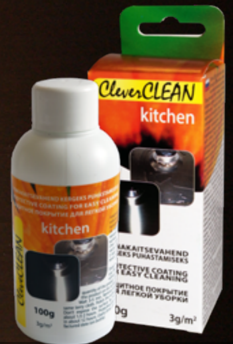
100g pudel karbis CleverCLEAN köögile